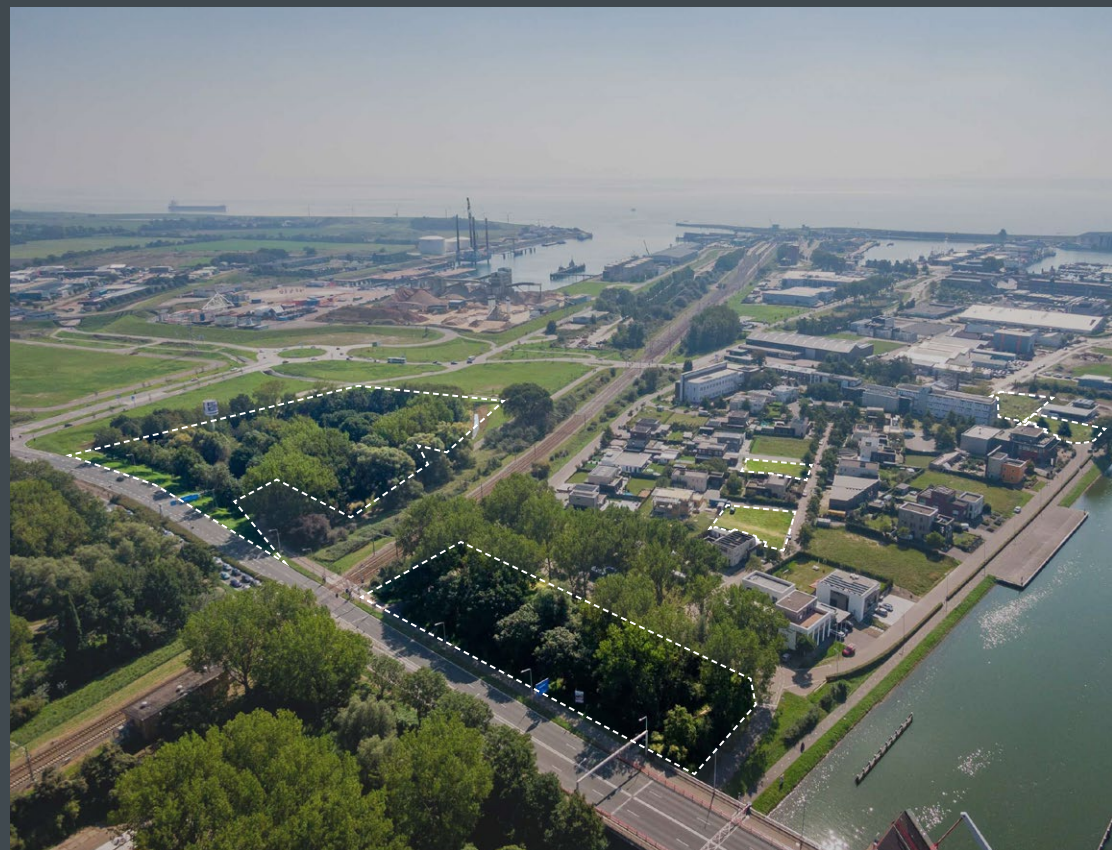
Overzicht van de grootste percelen.